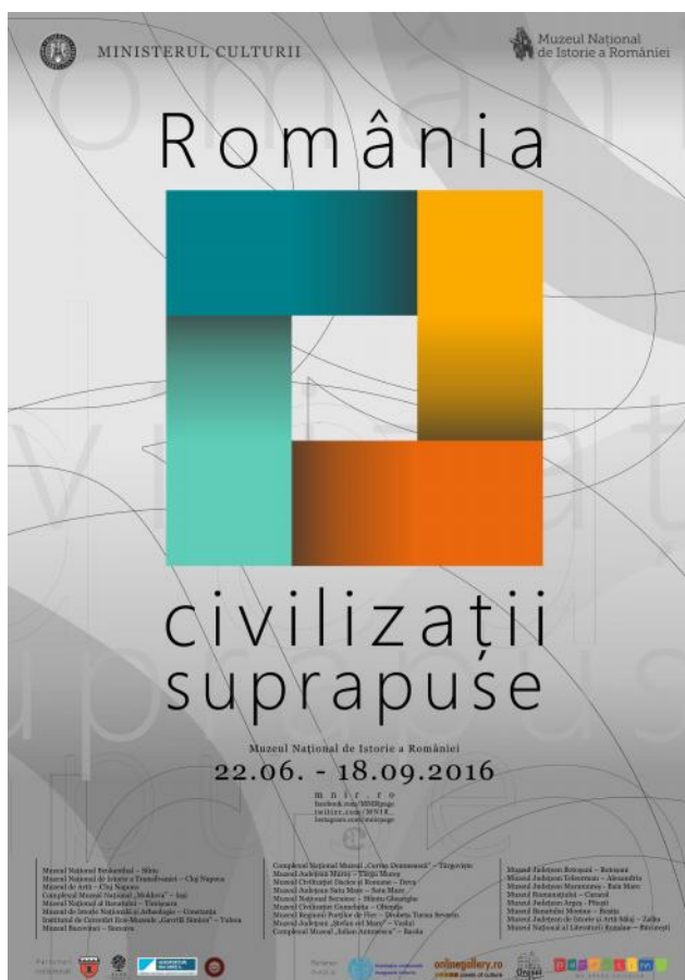
Afișul expoziției România-civilizații suprapuse . Sursa (2)

Acestea sunt rezultatele. Acesta este citatul.