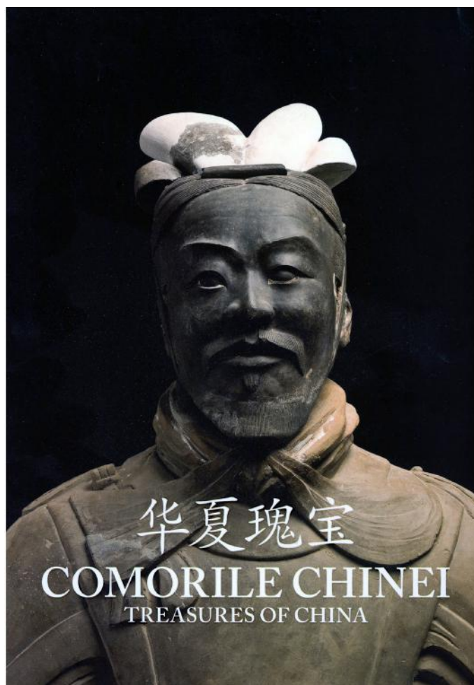
Coperta catalogului expoziției Comorile Chinei/Treasures of China

Universul nostru centripet presupunea planificarea spațiului și timpului a producerii timpului, acum spațiul național este întotdeauna exterior realităților de noduri la care îl conectăm oportunist printr-un gen de management al trecutului. Pe vremea noastră , schimbul de daruri dorea să pară simbolic, o topire în esență a gesturilor arhetipale a acelui amestec dintre discursul timpific al Partidului unit în jurul lui Nicolae Ceaușescu ( legi obiective universale valabile – principiile socialismului timpific – concepția materialistă despre lume și societate – pe baza celor mai noi cuceriri ale științei și tehnicii – cerințe legitime, inexorabile, a progresului contemporan – necesitate obiectivă ) și trăsăturile extatic-revoluționare ale oamenilor muncii ( entuziasm frenetic și trimis în miezul unui ev aprins și cei ce nu ard dezlănțuiri noi / în flăcările noastre se destramă și Cântarea României și Dacia ), iar azi schimbul se prezintă drept economie pur desfășurată după legi timpifice care guvernează până și extazul consumului din reclame.