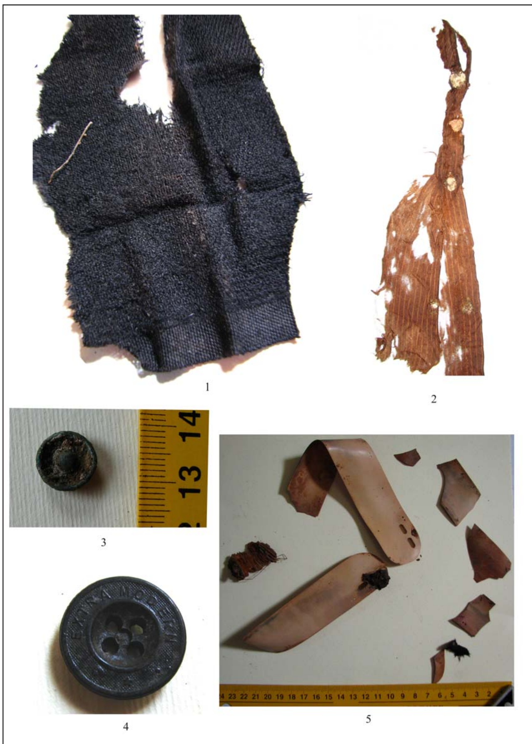
Fig. 4. Elemente de vestimentație ce au aparținut episcopului Vasile Aftenie: pantaloni (1); cămașă (2); nasturi (3-4); colar (5).