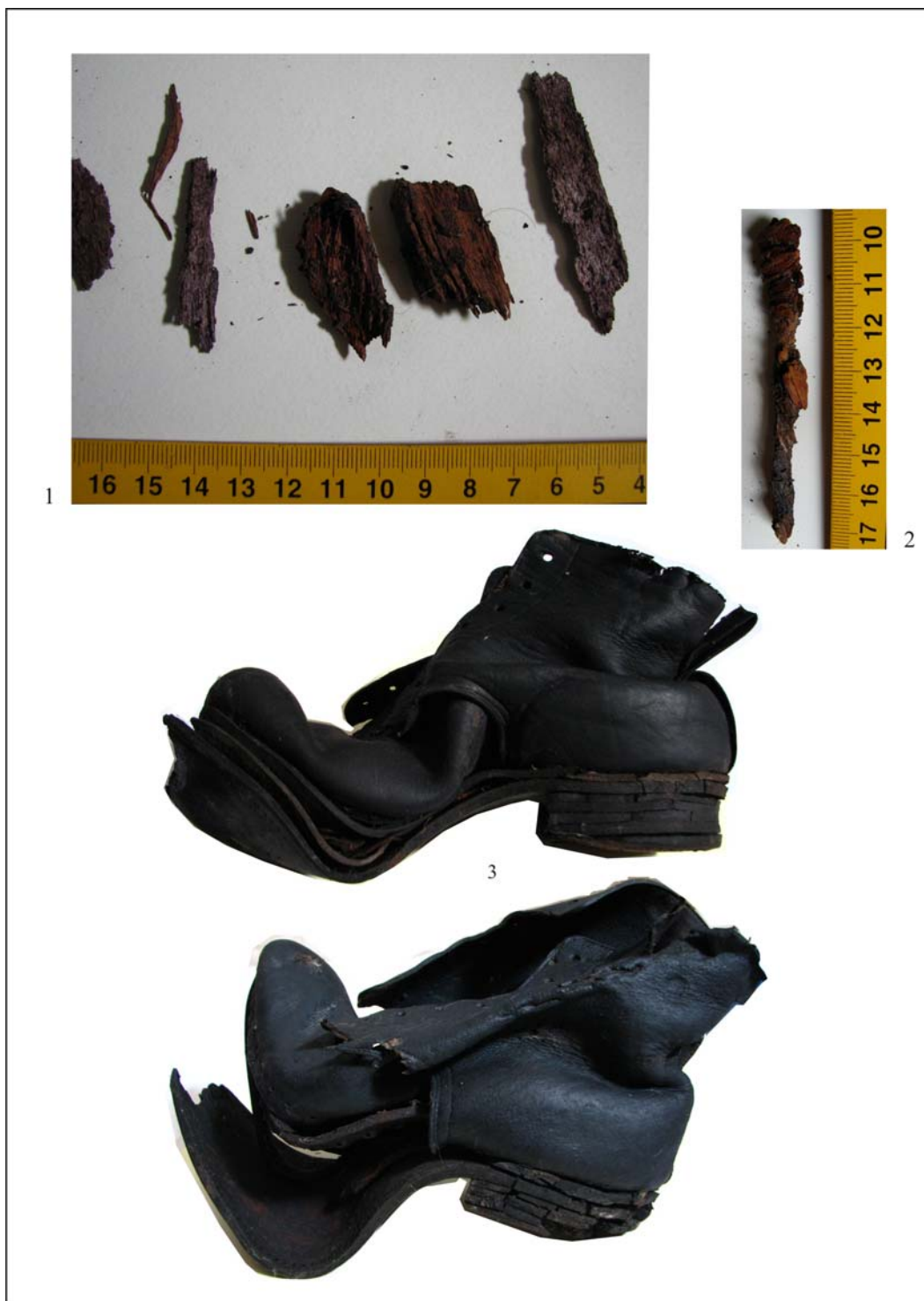
Fig. 3. Fragmente de lemn (1) și unul dintre cuiile (2) provenite de la sicriul/lada în care a fost înmormântat episcopul Vasile Aftenie; bocancii cu care a fost înmormântat episcopul (3).