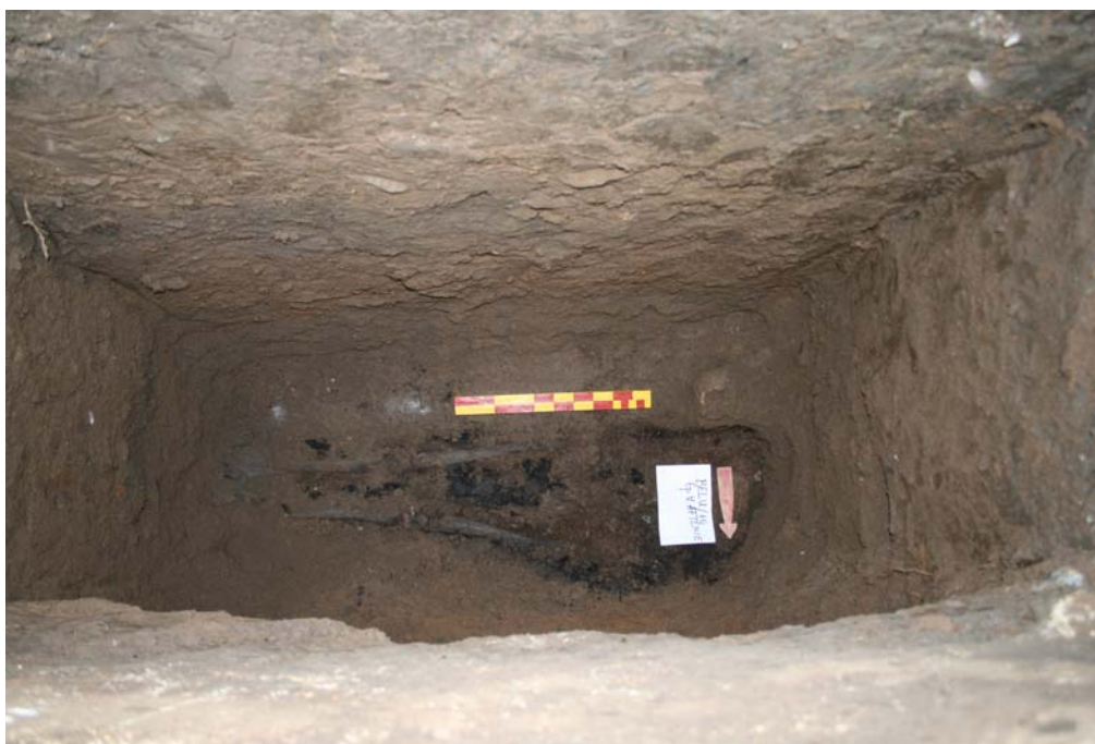
Fig. 2. Osemintele episcopului Vasile Aftenie in situ .

Slab conservate (vezi raportul antropologic), osemintele episcopului se aflau la adâncimea de 1,98-2,06 m, calculată de la marginea superioară a bordurii. Corpul episcopului fusese depus în decubit dorsal întins, cu capul la vest ( Fig. 2 ). Membrele superioare nu s-au păstrat, dar orientarea și poziția părților păstrate ale corpului (craniu și membre inferioare) indică depunerea corpului în conformitate cu ritualul creștin.