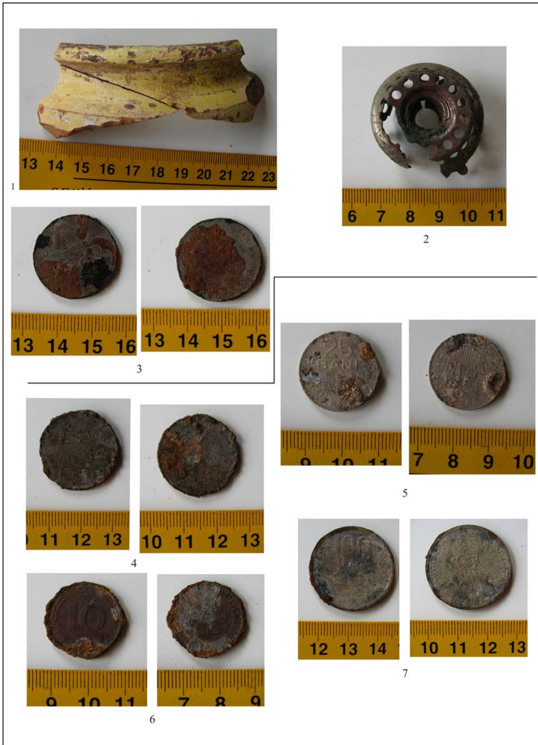
Fig. 7. Obiecte din „stratul III” (1-3) și din „stratul II” (4-7): fragment ceramic (1); fragment de candelă (2); monede (3-7).