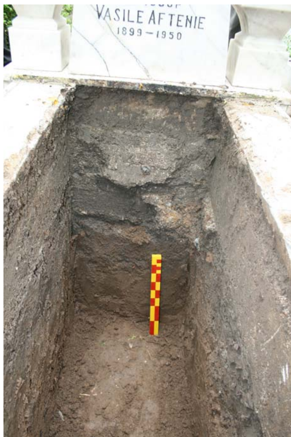
Fig. 6. Profilul de vest al mormântului episcopului Vasile Aftenie.