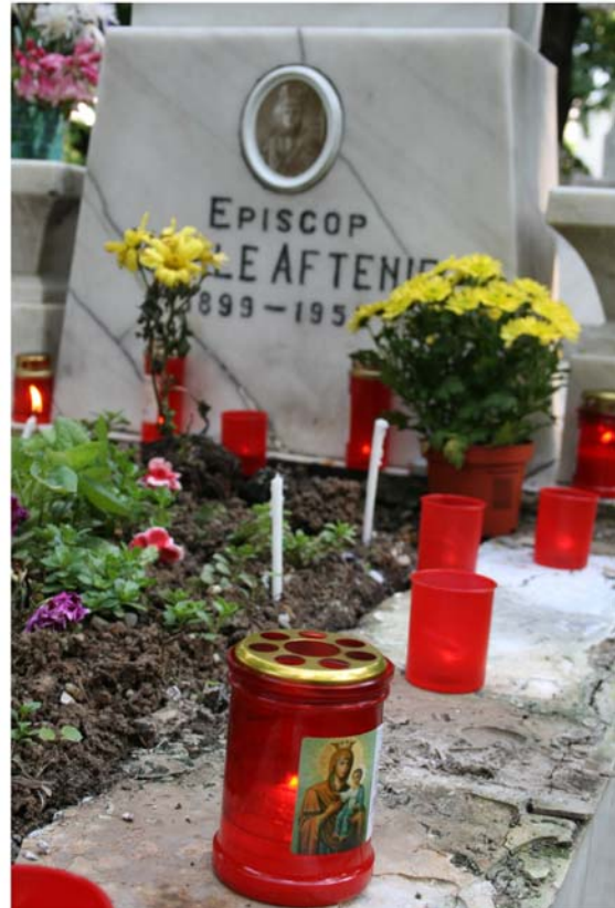
Fig. 9. Candele și lumânări aprinse de credincioși la mormântul episcopului Vasile Aftenie.