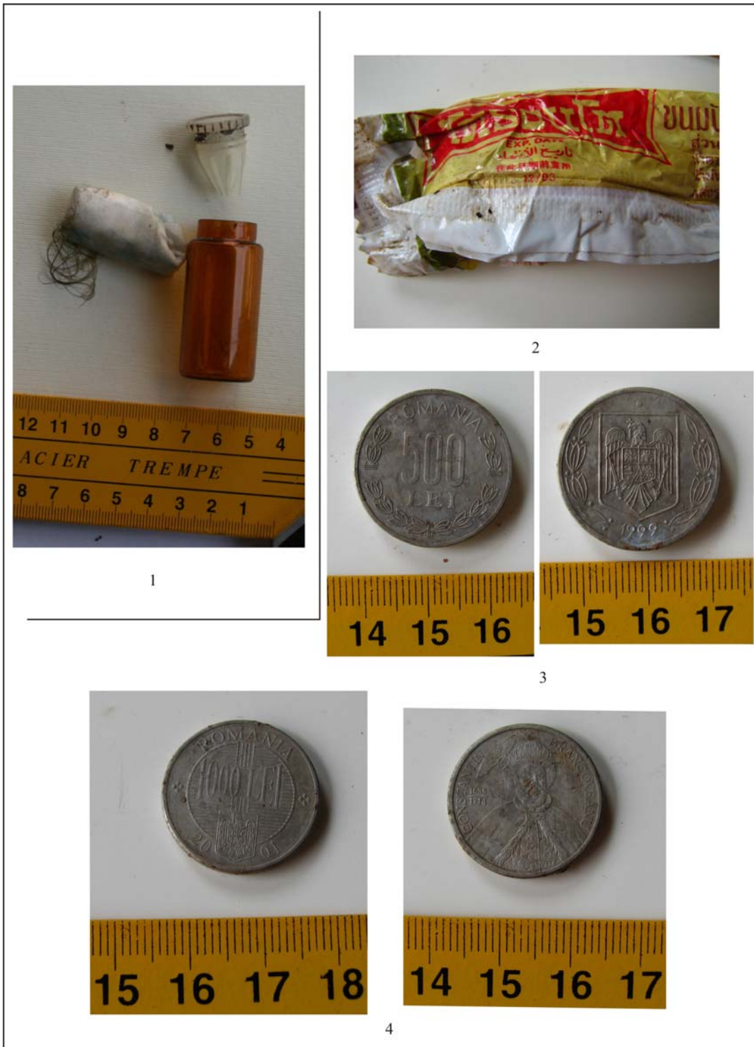
Fig. 8. Obiecte din „stratul II” (1) și din „stratul I” (2-4): flacon ce conținea o rugăciune și fire de păr (1); ambalaj de dulciuri (2); monede (3-4).