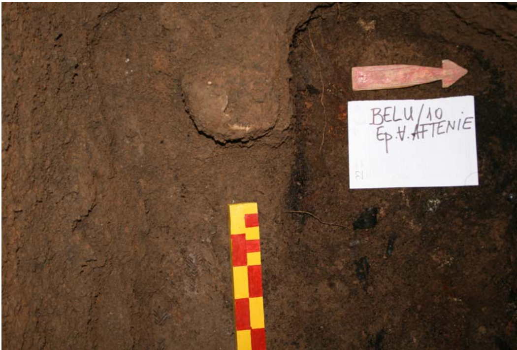
Fig. 5. Fragment de craniu ce a aparținut femeii înmormântate înainte de episcopul Vasile Aftenie în aceeași parcelă (găsit în umplutura gropii mormântului, în „stratul III”).

Bordura și crucea au fost amenajate într-o depunere cenușie, argiloasă, având grosimea de 0,55-0,60 m („stratul II”). Fundația crucii se adâncește în depunerea cenușie până la -0,63 m, fiind ușor aplecată spre interior din cauza greutății proprii și a instabilității pământului de umplură. Odată cu amenajarea monumentului a fost depus un strat pentru flori, de culoare brun-deschis, gros de 5-10 cm („stratul I”) ( Fig. 6 ).